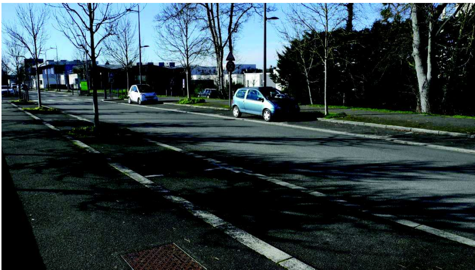
Le parking de la Gare à l'heure du marché le samedi matin