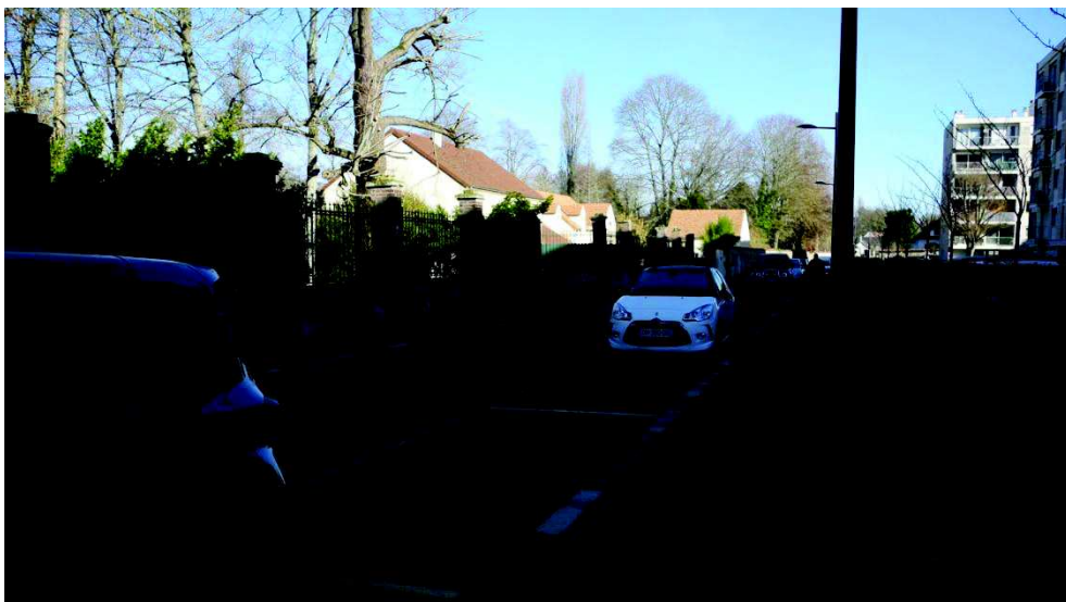
La rue de la Savonnière à l'heure du marché le samedi matin

A condition d'effectuer au maximum 5 à 7 minutes de marche, il n'existe pas ou peu de problème de stationnement le samedi matin, jour de marché, même en tenant compte de la disparition de 34 emplacements sur la Place Aristide Briand.