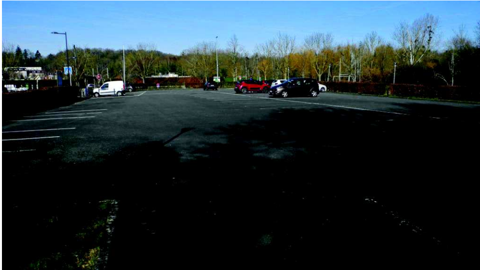
Le parking des Prairiales à l'heure du marché le samedi matin