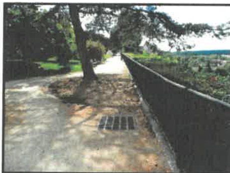
Figure 32: Collecteur d'eau pluviale à l'amont de la zone du glissement de terrain