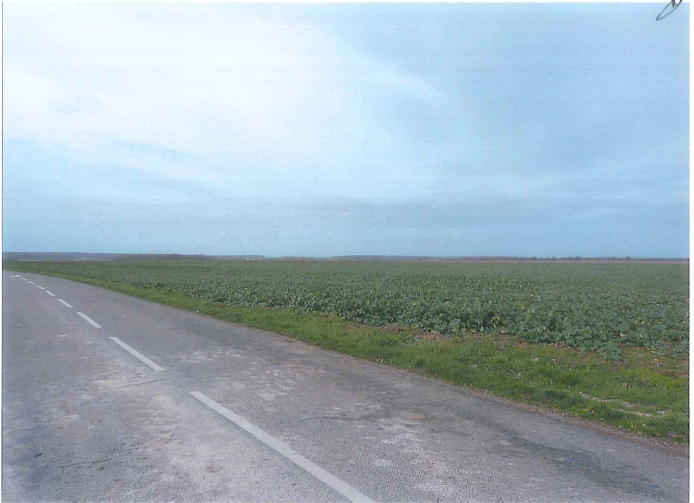
vue sur coté eekennes .