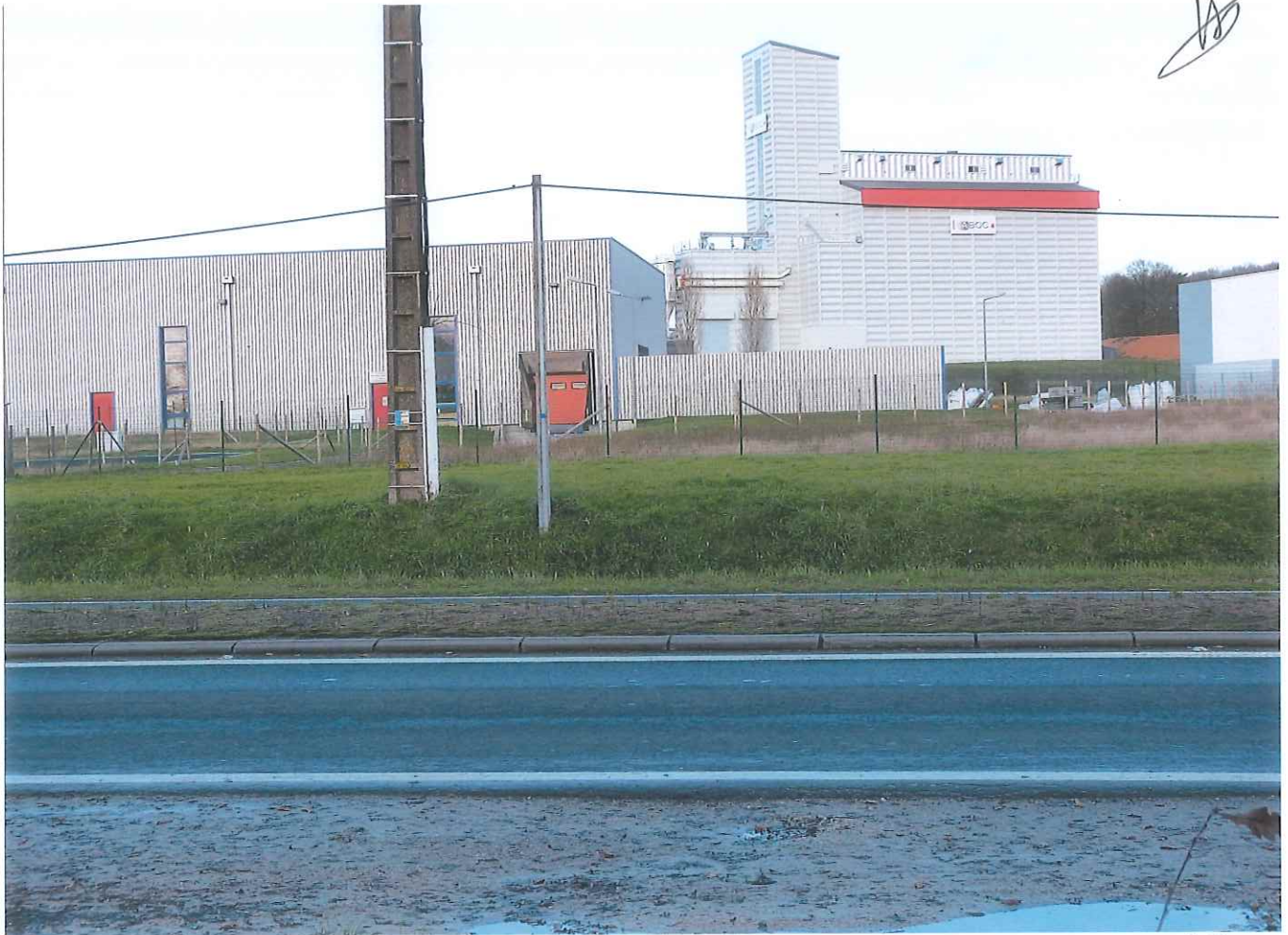
Sortie autoroute Ligny - (silo récent) Porte d'entrée du parc naturel du perche