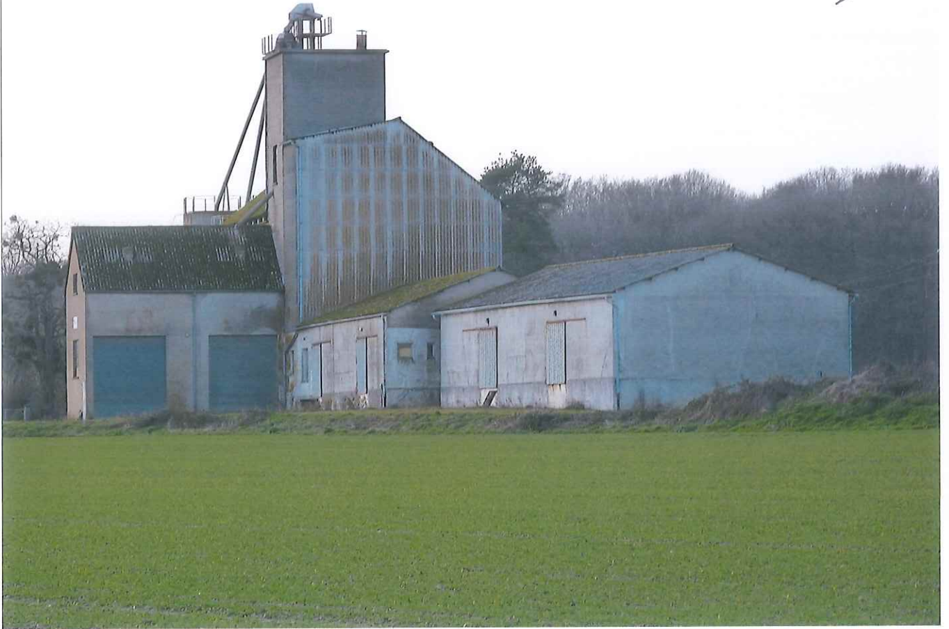
Sortie de FRAZE : Parc naturel du perche