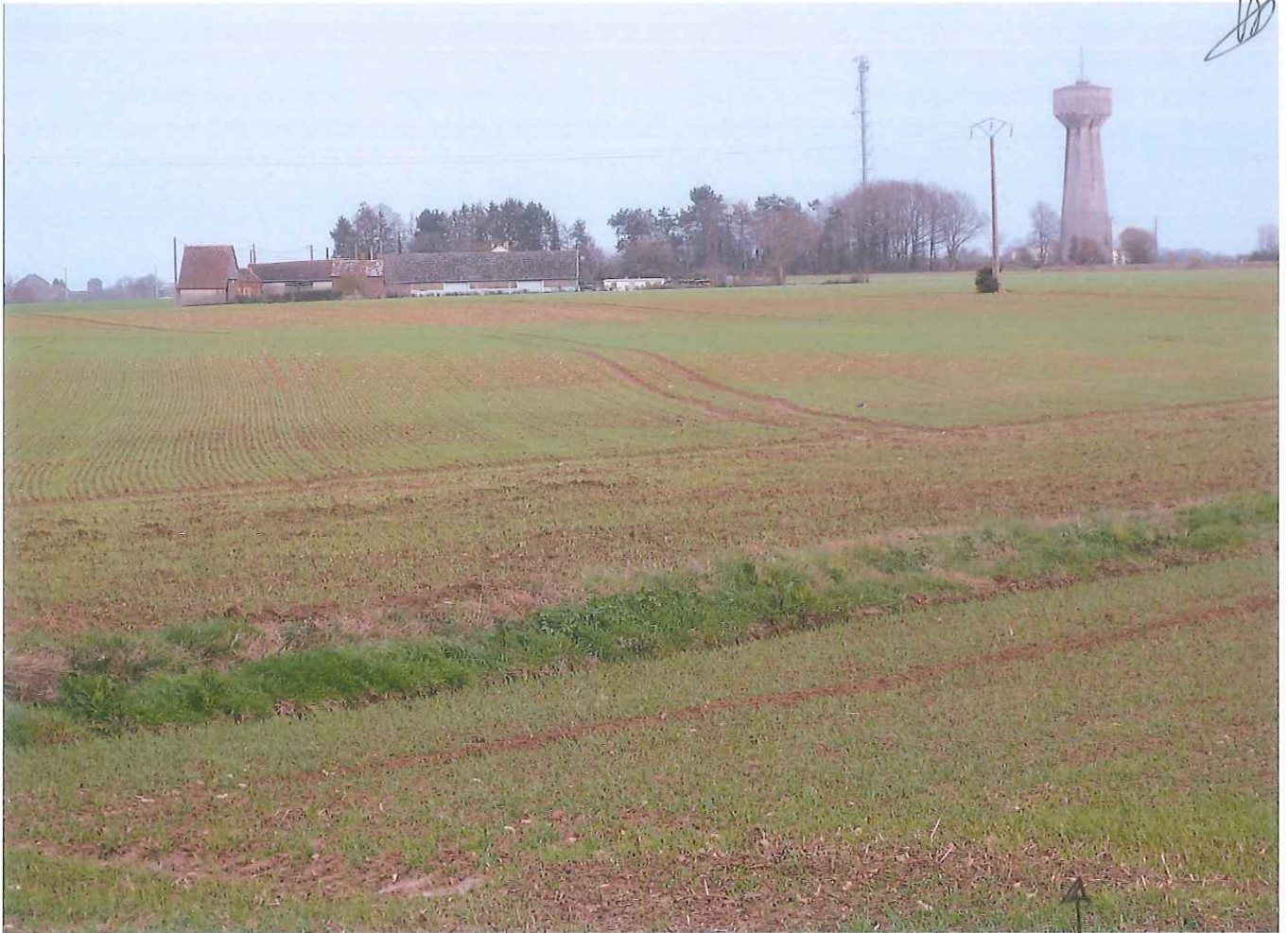
Jliers . route de merglise