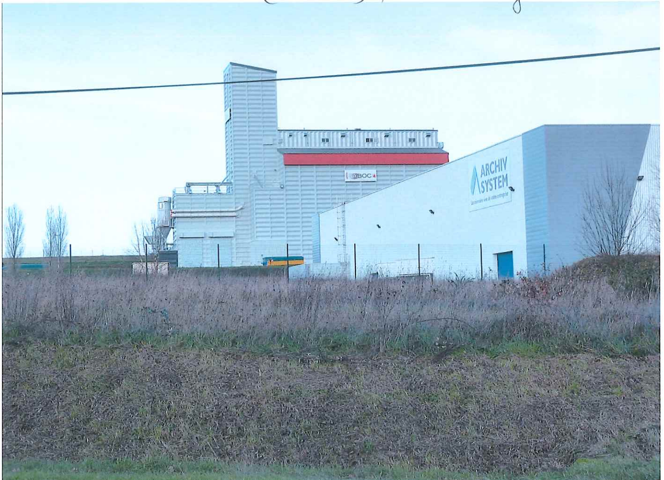
Luigny. sortie autoroute (porte des PNP)