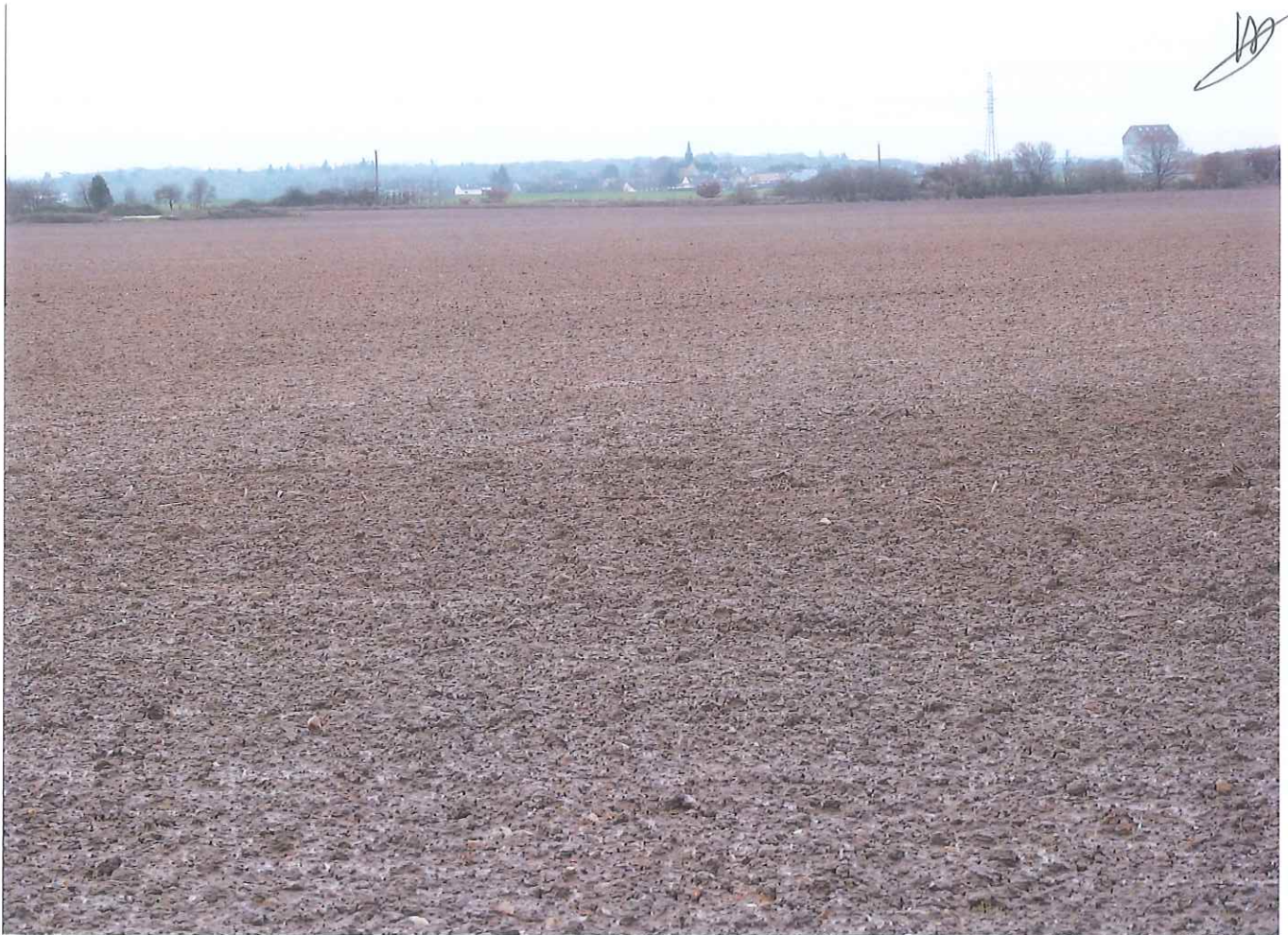
Viewicq. (cote futures eoliennes)