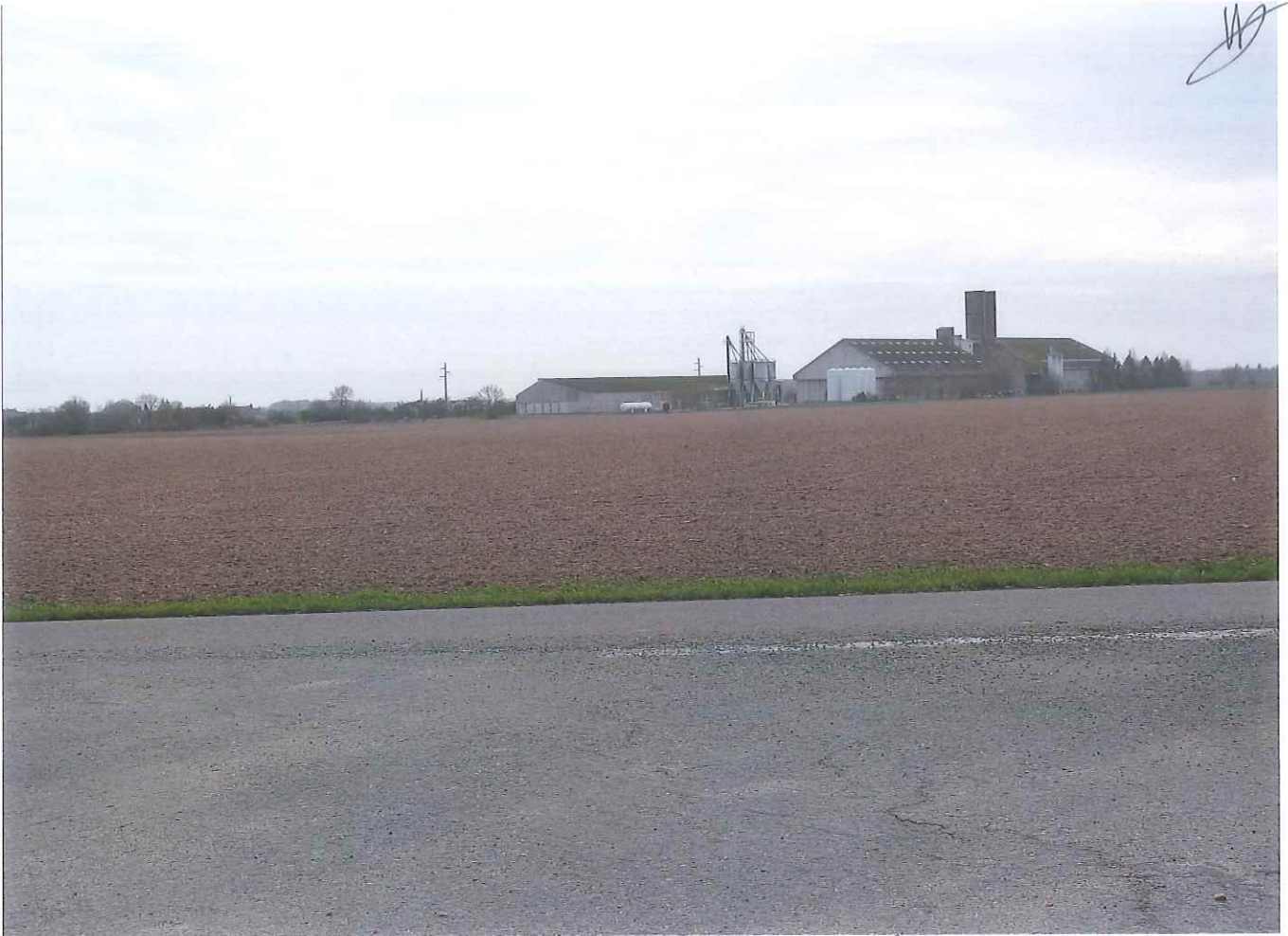
veunep et ses silos