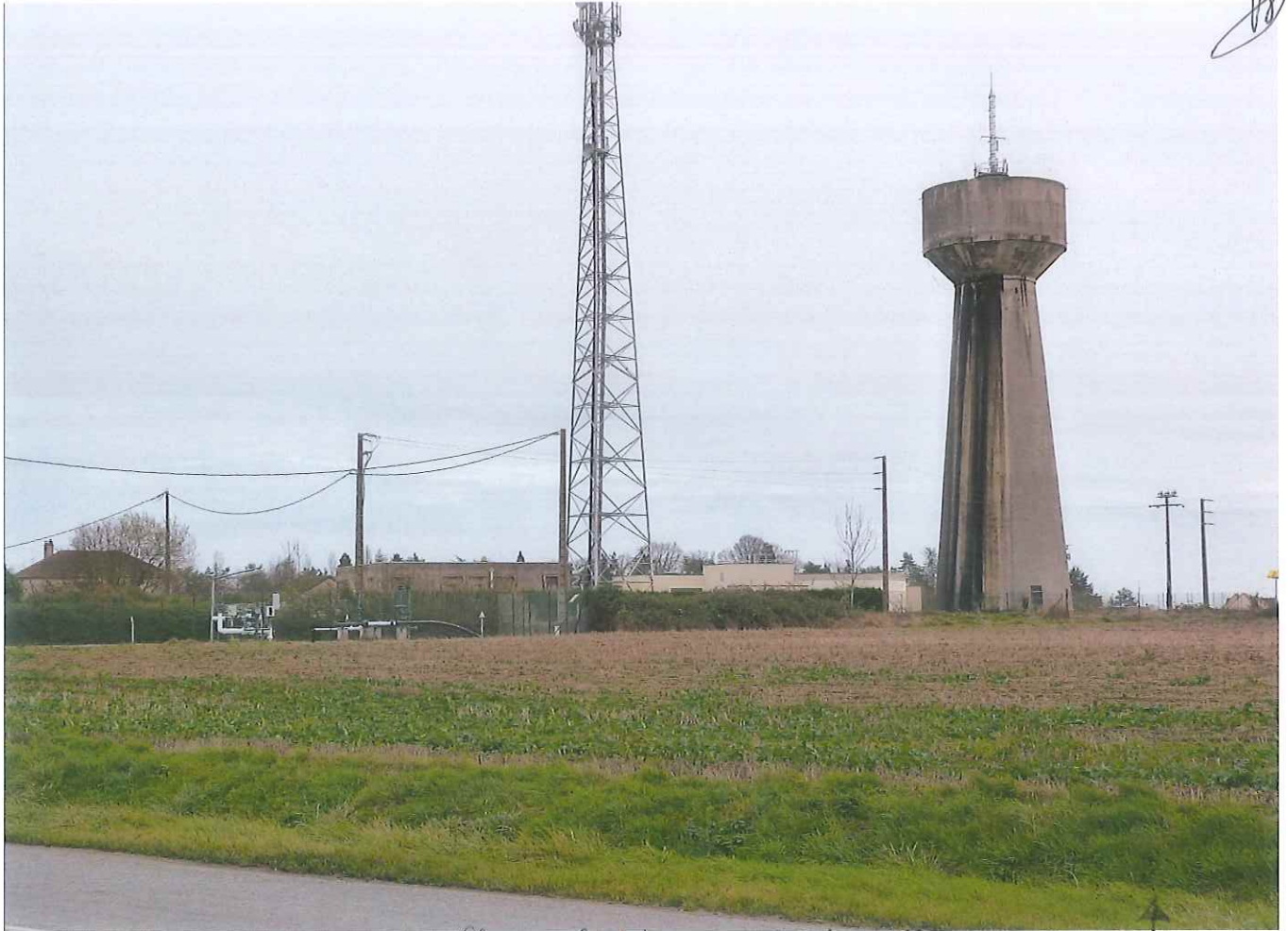
Illiers Combray route de mereglise