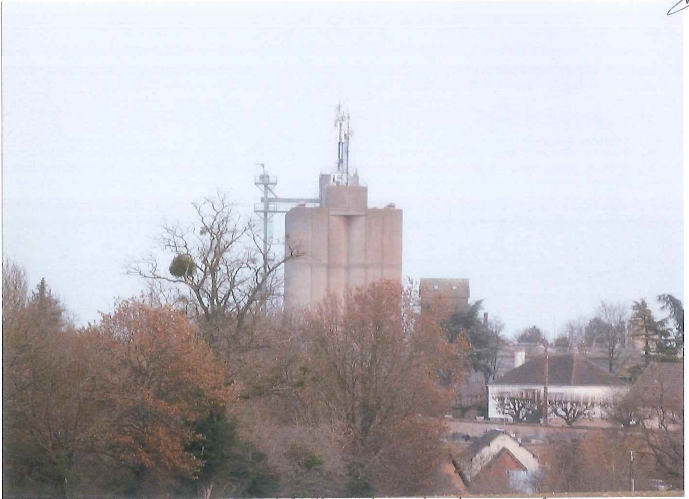
(Illiers) route de meréglise.