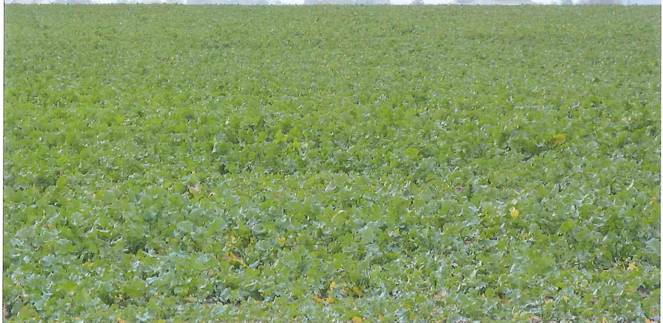
Vieuxicy (côté opposé aux éoliennes)