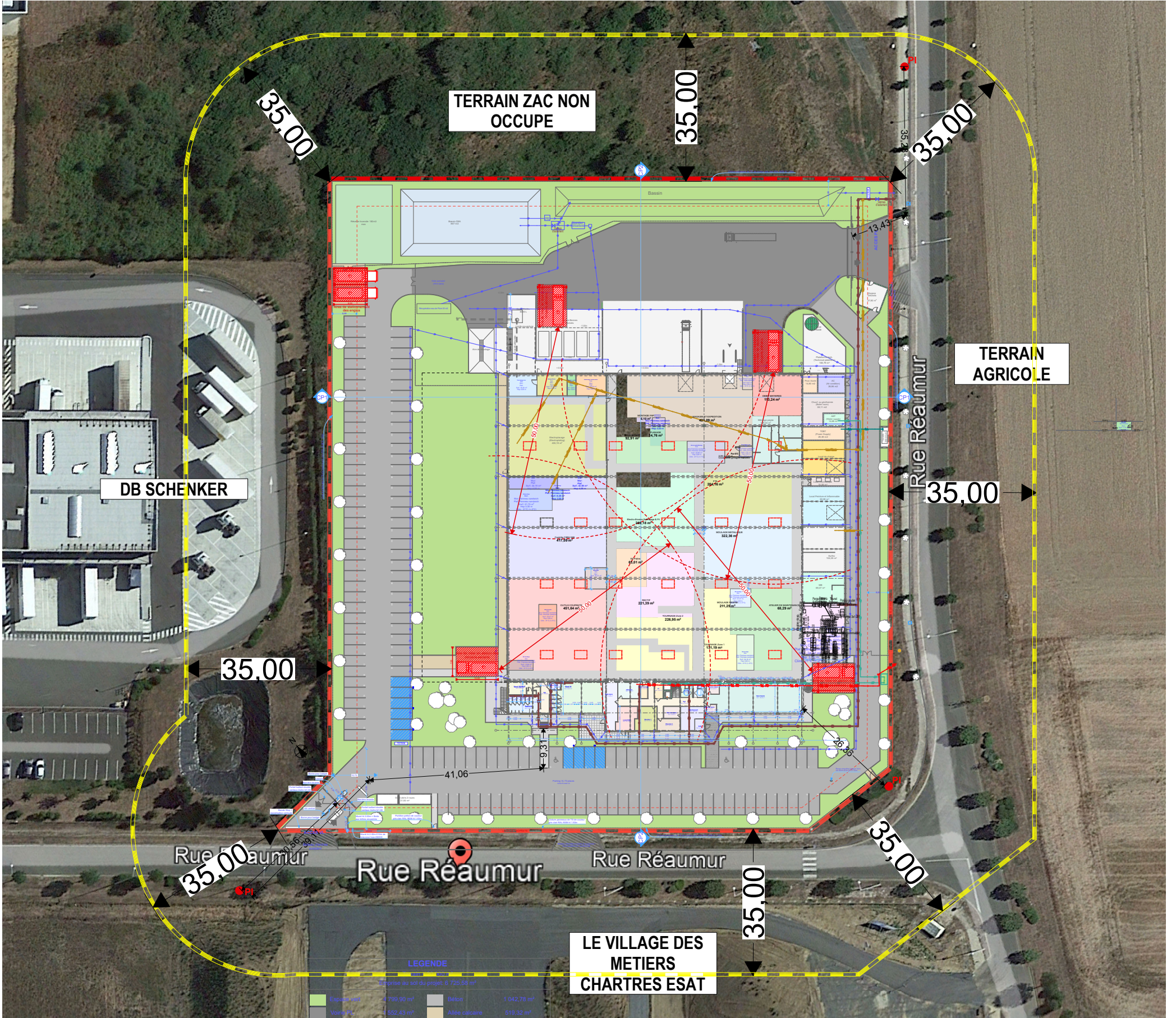
Plan de masse ICPE Rayon 35m